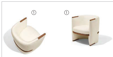
1 Opus 77100 penny 6704 fin. 11